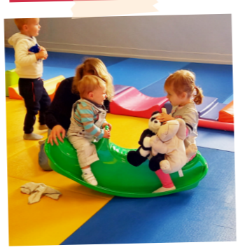
Les doudous ont aussi fait de la motricité avec les enfants.

EN NOVEMBRE ET DÉCEMBRE, LES ENFANTS ONT PRIS SOIN D'EUX ET DES AUTRES.