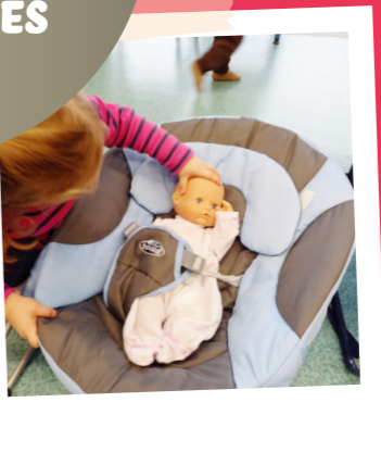
Des poupons, des vêtements, des biberons... Les enfants ont testé le métier d'assistantes maternelles et s'en sont sortis comme des chefs.