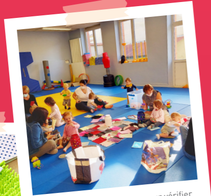
On a touché des matières pour vérifier si elles sont aussi douces que les doudous.

EN SEPTEMBRE ET OCTOBRE, LES ENFANTS ONT BALADÉ LEURS DOUDOUS PARTOUT.