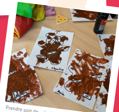
Prendre soin de... c'est aussi soigner, alors on a mis des pansements à nounours qui avait mal partout et on a vérifié que personne n'avait de fièvre.