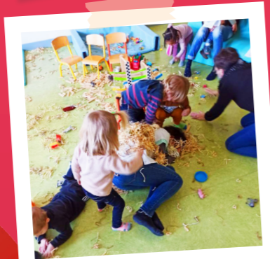
On cache des objets puis on essaie de les retrouver. C'est plus dur de cacher l'animatrice.