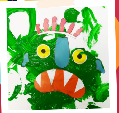
Les enfants affrontent le grand monstre vert. Va-t-en grand monstre vert, tu ne me fais pas peur !