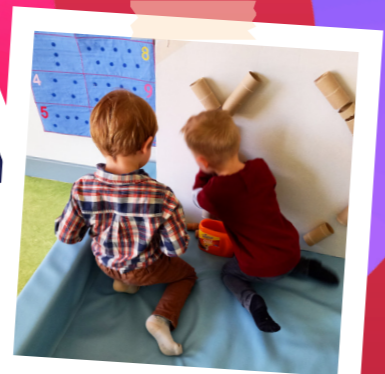
Les bouchons jouent à cache-cache dans les tubes.