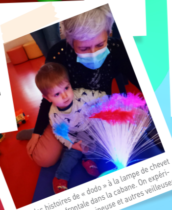
On lit des histoires de « dodo » à la lampe de chevet ou encore à la frontale dans la cabane. On expérimente aussi la table lumineuse et autres veilleuses.