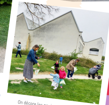
On décore les paniers puis les enfants partent à la recherche des œufs.