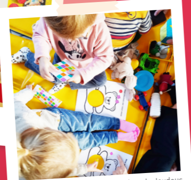
Les enfants ont écouté des histoires de doudous, fabriqué des doudous tout doux et fait des cadres pour exposer la photo de leur doudou.